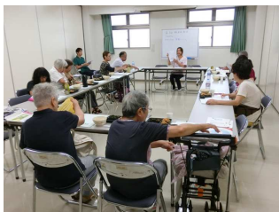
【食事を摂りながら、管理栄養士とカロリー計算を行いました。】